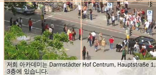
저희 아카데미는 Darmstädter Hof Centrum, Hauptstraße 1, 3층에 있습니다.