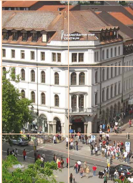
Naša škola stranih jezika nalazi u trgovačkom centru „Darmstädter Hof“ ulica Hauptstraße 1, na trećem katu