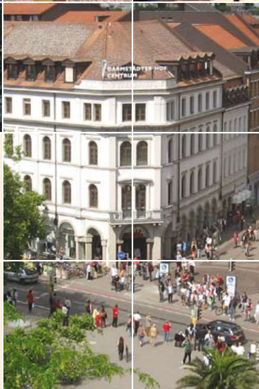
Unsere Sprachschule im Darmstädter-Hof-Centrum, 3. OG, Hauptstraße 1

Marketingkommunikation/PR, Industrie/Handel/Banken/Versicherungen, Sportmanagement, Gastronomie-Management, Event-, Messe- und Kongressmanagement u.a.